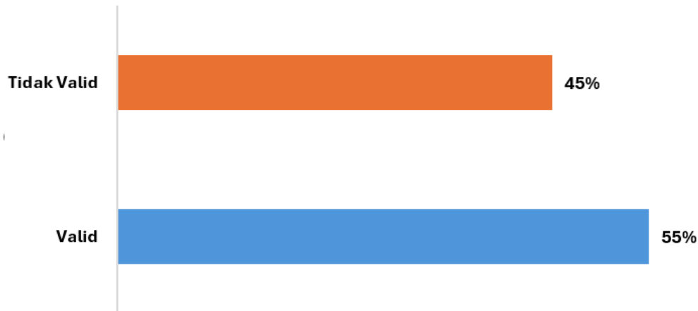
Gambar 1. Persentase (%) Uji Validitas Butir Soal Materi Sistem Pencernaan Manusia

Soal yang valid lebih akurat dalam mencerminkan penguasaan konsep siswa, namun soal yang tidak valid memungkinkan terjadi bias penilaian. Maka seharusnya soal yang tidak valid direvisi atau dihilangkan. Soal yang valid dapat dihimpun ke dalam kumpulan soal sebagai arsip, tetapi soal yang tidak valid sebaiknya dihapuskan dan direntangkan kembali menjadi soal yang valid (Anazar & Munir, 2024; Dianova & Anwar, 2024; Rachmawati & Pradana, 2025).